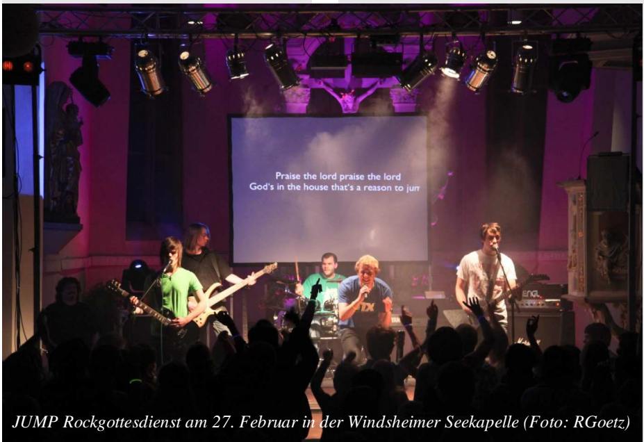
JUMP Rockgottesdienst am 27. Februar in der Windsheimer Seekapelle

Anmeldung findet ihr auf unserer Homepage (siehe oben!).