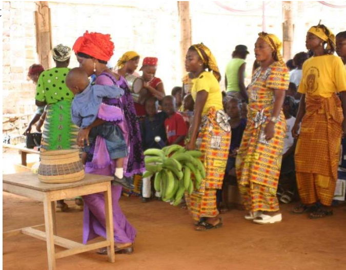
Gottesdienstkollekte im Kongo: Geld und Naturalien

Anfang November hat sich ein neuer Arbeitskreis unseres Dekanatsbezirks getroffen, der die Partnerschaft zur Evangelisch-Lutherischen Kirche im Kongo weiterbringen will. Der Kongo ist ein aufregendes Land mit extrem schwierigen Lebensbedingungen. Wer Interesse hat, darf gern dazu kommen.