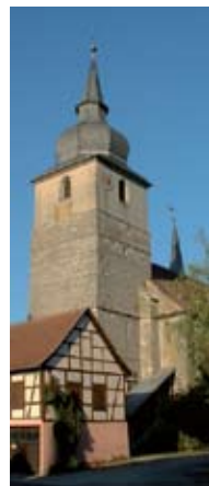
St. Johannis in Ipsheim, wo am 16. Mai um 9 Uhr die Dekanatssynode beginnt