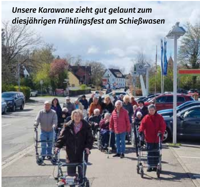
Unsere Karawane zieht gut gelaunt zum diesjährigen Frühlingsfest am Schießwasen