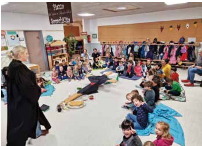
Ostergottesdienst und Fastenweg (unten)

In der Osterzeit haben die Kinder im Kindergarten einiges erleben dürfen. Um die Dauer der Fastenzeit bis Ostern sichtbar zu machen, gestalteten wir im Eingangsbereich einen Osterweg mit 40 Fußspuren. Diese symbolisierten die 40 Tage bis Ostern von Aschermittwoch an. Jeden Tag durften die Kinder die Fußspuren ausmalen und konnten so erleben, wie lange es noch bis Ostern dauert. Während der Fastenzeit erarbeiteten wir wöchentlich im besonderen Osterkreis mit Pfr. Frau Fucker und den Kindern die Ostergeschichte. Innerhalb des Kreises wurden Osterlieder gesungen und Pfr. Frau Fucker erzählte den Kindern Stück für Stück die Ostergeschichte.